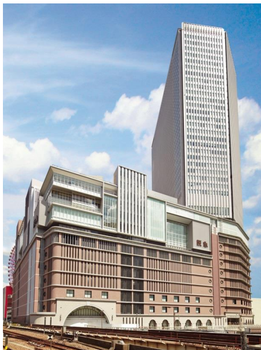
■ 阪急百貨店 うめだ本店