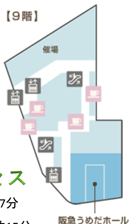
■ 阪急百貨店 うめだ本店